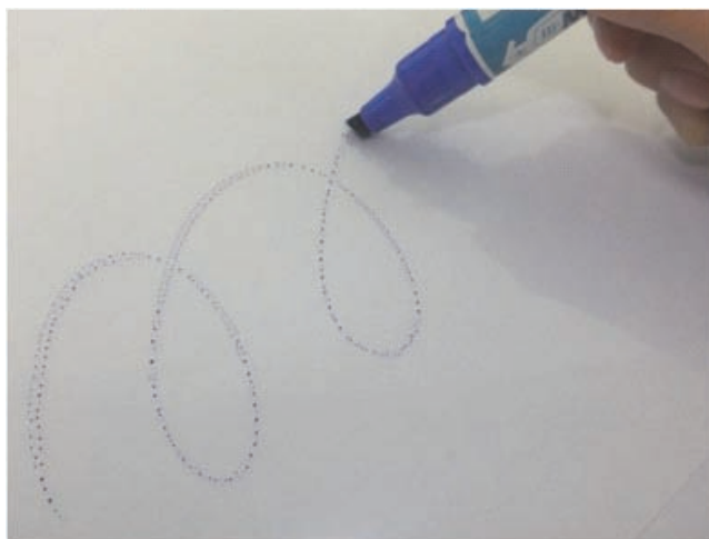
油性マジックもはじく